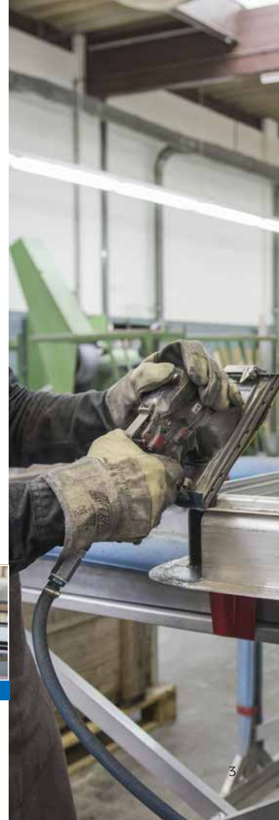
Schleiferei Grinding shop