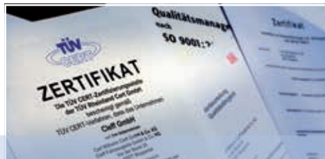
Qualitätszertifikate Quality certificates