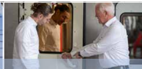
Funktionsprüfung Function test