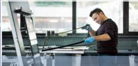
Produktion Fahrzeugfenster Vehicle window production