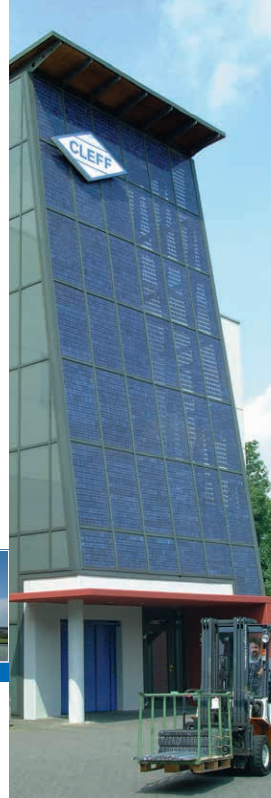
Solarturm Solar tower