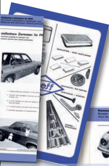
Prospektblätter der 60er und 70er

The entire workforce operating together as one team, with all the administrative and technical departments forming a single entity, each complementing the other.