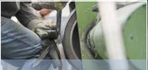
Schleiferei Grinding shop