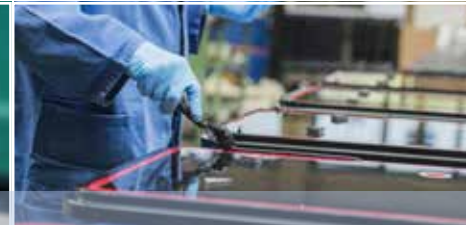
Montage von Fahrzeugfenstern Assembly of vehicle windows